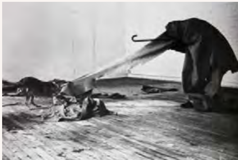
Crédit photo © Joseph Beuys – I like America and America likes Me – 1974